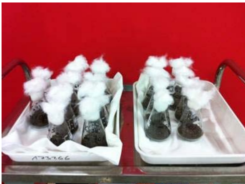
Abbildung: Inkubationsversuch über die Weihnachtszeit

Die meisten chemischen Elemente besitzen mehrere sogenannte Isotope. Die Isotope eines Elementes unterscheiden sich nur in der Anzahl der Neutronen im Kern. Dadurch können sie auf Grund ihrer unterschiedlichen Massen analytisch getrennt werden und somit kann auch das sogenannte Isotopenverhältnis - also das Verhältnis zweier stabiler Isotope (z.B. ^{12}\text{C} zu ^{13}\text{C} ) bestimmt werden. Das Isotopenverhältnis verändert sich bei zahlreichen physikalischen, chemischen und biologischen Prozessen. Das führt dazu dass jeder Stoff (z.B. Schadstoff, Reaktionspartner, Boden, Wasser) eine charakteristische Isotopensignatur aufweist. Umgekehrt kann man aber auch durch eine Änderung in der Isotopensignatur über die Zeit auf den Ablauf bestimmter Prozesse rückschließen und diese Prozesse im Idealfall sogar quantifizieren. Dazu ist es allerdings notwendig zunächst die Stärke der Wirkung verschiedener Prozesse auf die Änderung der Isotopensignatur zu kennen. Diese Änderung wird mit Hilfe sogenannter Fraktionierungsfaktoren beschrieben. Kennt man den entsprechenden Fraktionierungsfaktor, so kann man damit unter anderem den biologischen Abbau eines Schadstoffes quantifizieren. Außerdem kann man mit der Analyse von Stabilisotopen aber noch zahlreiche andere Informationen gewinnen, wie etwa die Identifikation einer Schadstoffquelle, oder den Verbrauch eines im Rahmen einer in-situ Sanierung eingebrachten Reaktionspartners.