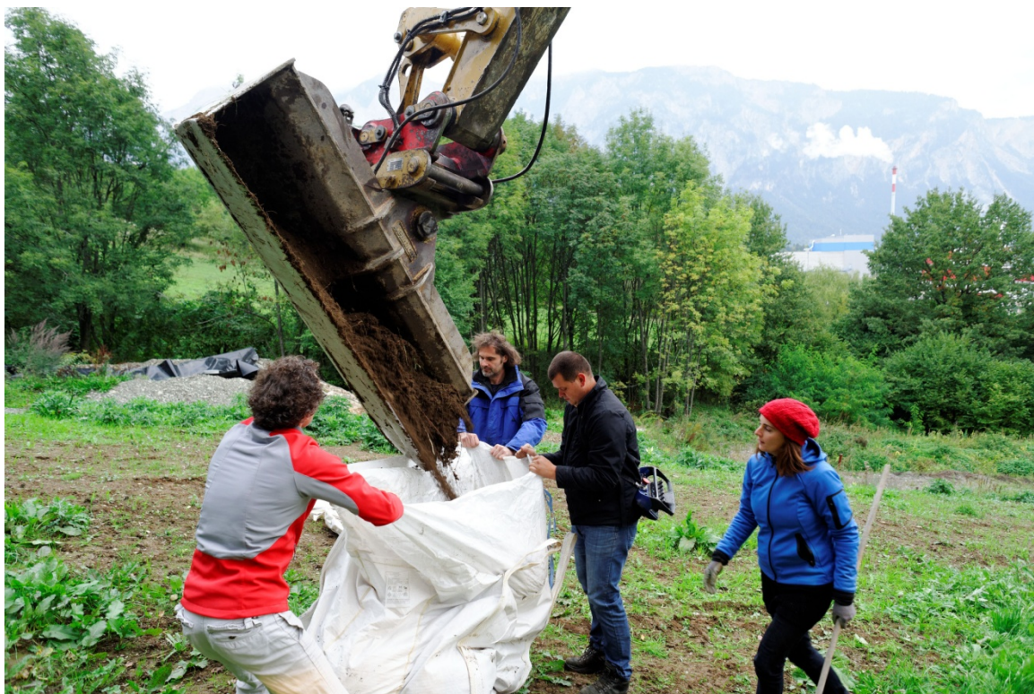
Abbildung: Bodenprobenahme in Arnoldstein für Inkubations- und Gefäßversuche

KONTAKT: DR. THOMAS G. REICHENAUER AUSTRIAN INSTITUTE OF TECHNOLOGY (AIT), ENVIRONMENTAL RESOURCES & TECHNOLOGIES KONRAD-LORENZ-STRASSE 24, A-3430 TULLN TEL: 050 550 – 3545, FAX: 050 550 - 3452, thomas.reichenauer@ait.ac.at