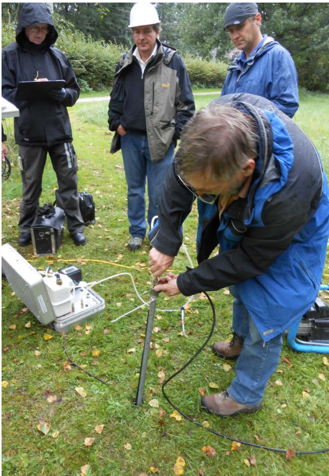
Abbildung: Temporäre Bodenluftprobenahme auf einer Altablagerung in Salzburg

Der 4. Probenahmekurs ist für den Zeitraum 19.-23. Mai 2014 in Fischamend / NÖ geplant.